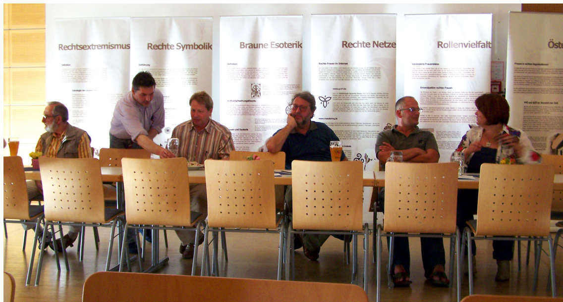
Ausstellung in Straubing